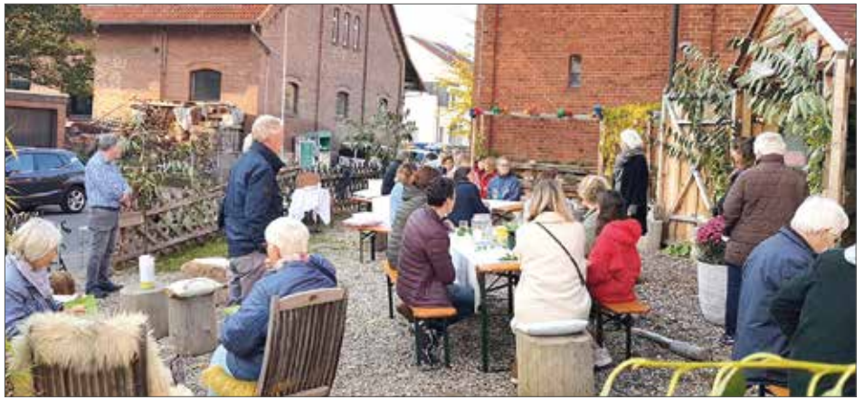
Rund 50 Besucher kommen auf den Platz an der St.-Godehard-Kirche.

Einen friedlichen November wünscht Sabine Jüttner