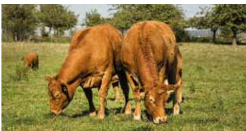
Fleischrasse „Limousin“ aus Groß Escherde