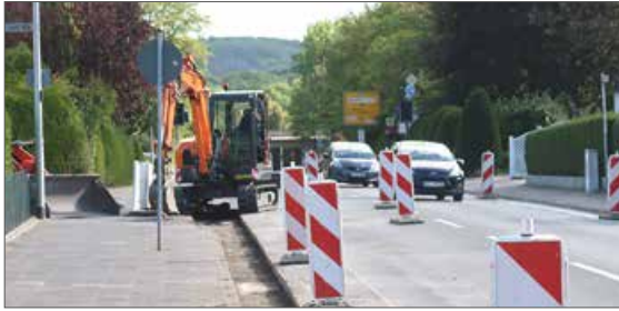
In der Wunramstraße wird die Gasse erneuert, bevor die Fahrradspuren auf der Straße eingerichtet werden.

Eine Bürgerin regte an, den Spielplatz neben dem Feuerwahrerätehaus einzuzäunen, um zu verhindern, dass Kinder auf die Straße laufen. Gleichzeitig wurde angesprochen, den Spielplatz mit einer überdachten Sitzgelegenheit