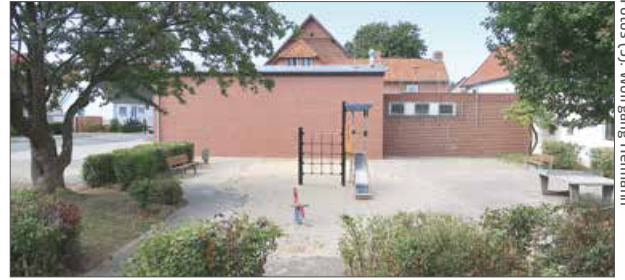
Der Spielplatz neben der Feuerwehr soll durch eine überdachte Sitzgelegenheit attraktiver werden.