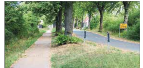
Unebenheiten auf dem Radweg an der Konrad-Adenauer-Straße sollen beseitigt werden.

soll. Das Konzept sieht für Ochtersum sowohl Freizeit-, Neben- und Haupttrouten vor. So ist der Fahrradweg westlich der B243 von der Ein-