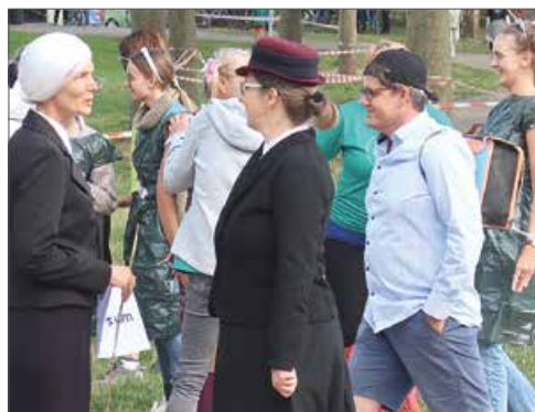
Zum „Spaßlauf“ treten zahlreiche Engagierte an, zum Beispiel Betreuungskräfte (links), Lehrkräfte und Mitglieder des Fördervereins (rechts).